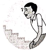
ਸਾਹ ਲੈਣ ਵਿੱਚ ਤਕਲੀਫ਼